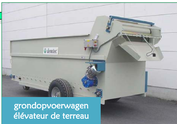
grondopvoerwagen élévateur de terreau