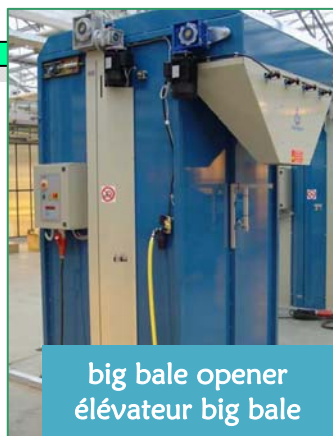
big bale opener élévateur big bale