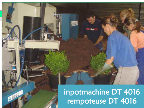
inpotmachine DT 4016 rempoteuse DT 4016