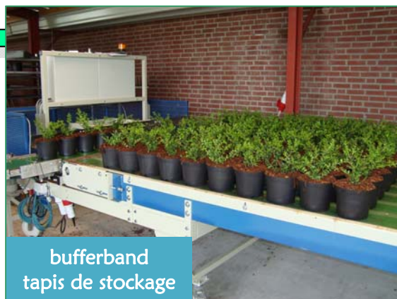
bufferband tapis de stockage