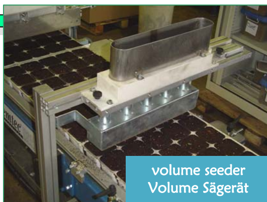
volume seeder Volume Sägerät