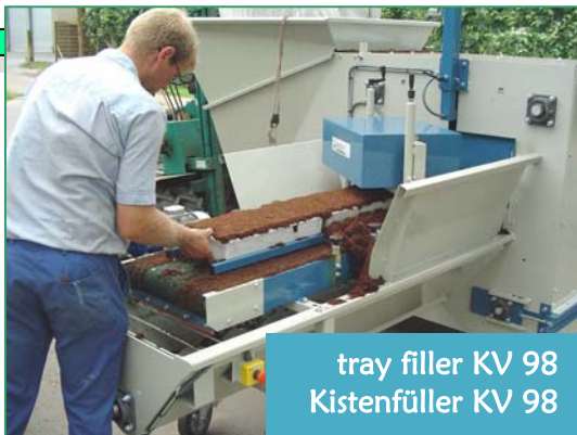
tray filler KV 98 Kistenfüller KV 98