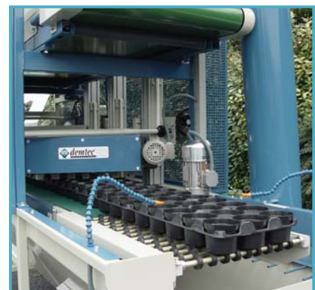
rotating brush drehende Bürste