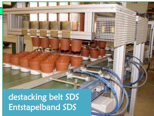
destacking belt SDS Entstapelband SDS