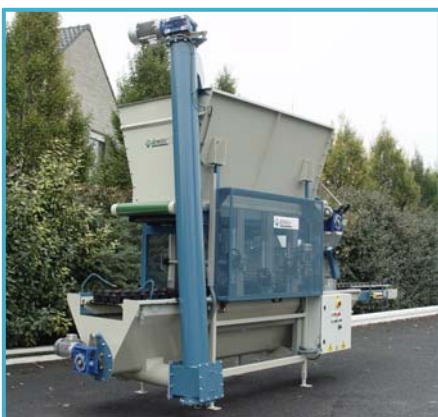
soil recycling Erdrekuperation