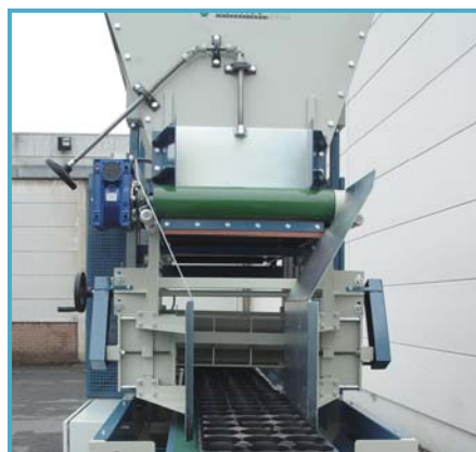
filling mechanism Füllung