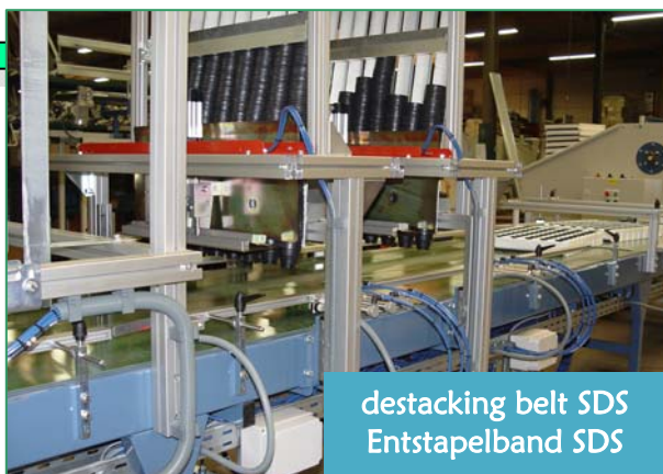
destacking belt SDS Entstapelband SDS