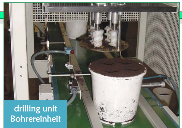
drilling unit Bohrereinheit