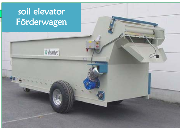
soil elevator Förderwagen