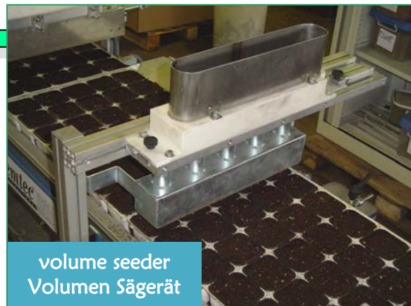
volume seeder Volumen Sägerät