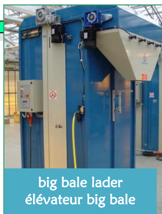
big bale lader élévateur big bale