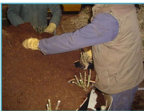
inpotten blote wortels empoter racines nues