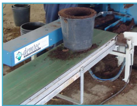
boren tot Ø 27 cm forer jusque Ø 27 cm