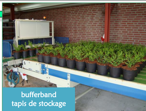
bufferband tapis de stockage