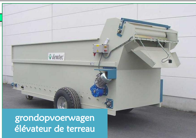
grondopvoerwagen élévateur de terreau