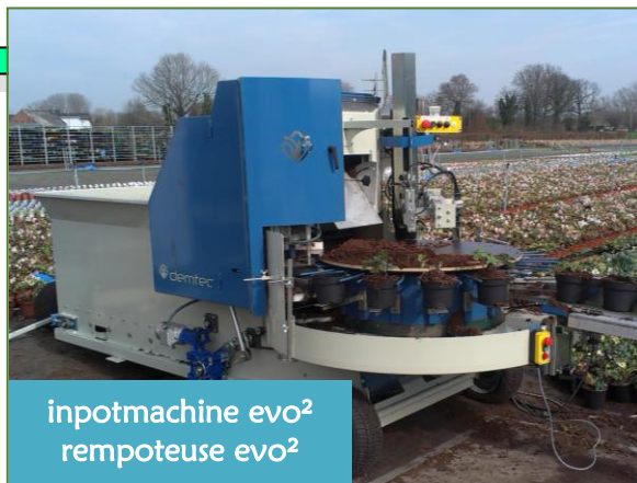
inpotmachine evo 2 rempoteuse evo 2