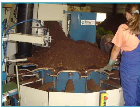
bijveegschof met meedraaiende schijf trappe terreau avec plateau tournant