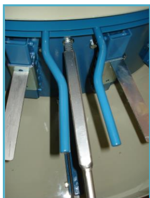
centrale verstelling pottenkransen réglage central des couronnes