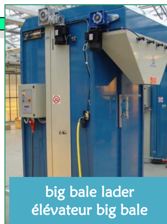
big bale lader élévateur big bale