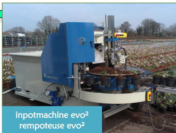
inpotmachine evo 2 rempoteuse evo 2