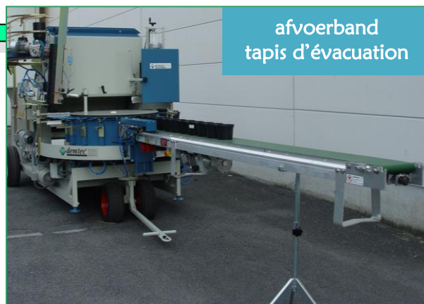
afvoerband tapis d'évacuation