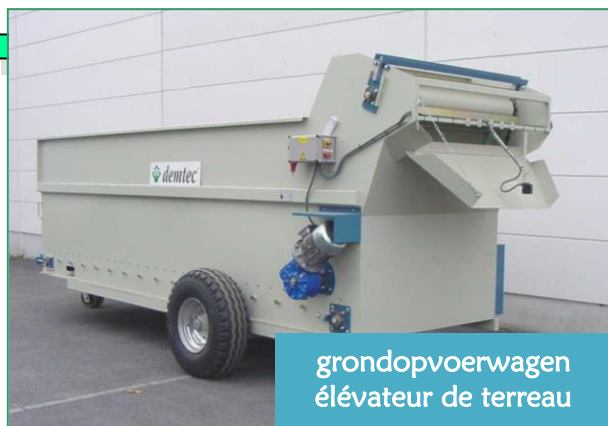
grondopvoerwagen élévateur de terreau