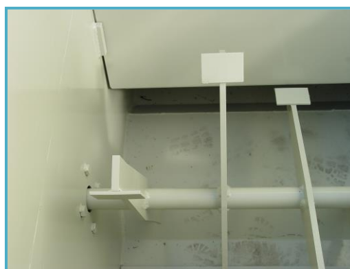
molen in grondbak, automatisch gestuurd broyeur dans bac à terreau, piloté automatiquement